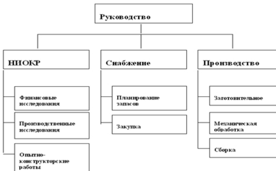
Рис. 3. Линейно-функциональная структура управления

Линейно-функциональная структура управления (рис. 3) основана на так называемом «шахтном» принципе построения и специализации управленческого процесса в зависимости от обязанностей, возложенных на заместителей руководителя - функциональных руководителей. К их числу относятся: коммерческий директор, заместители директора по кадрам, по производству, руководители информационного отдела, отдела маркетинга.