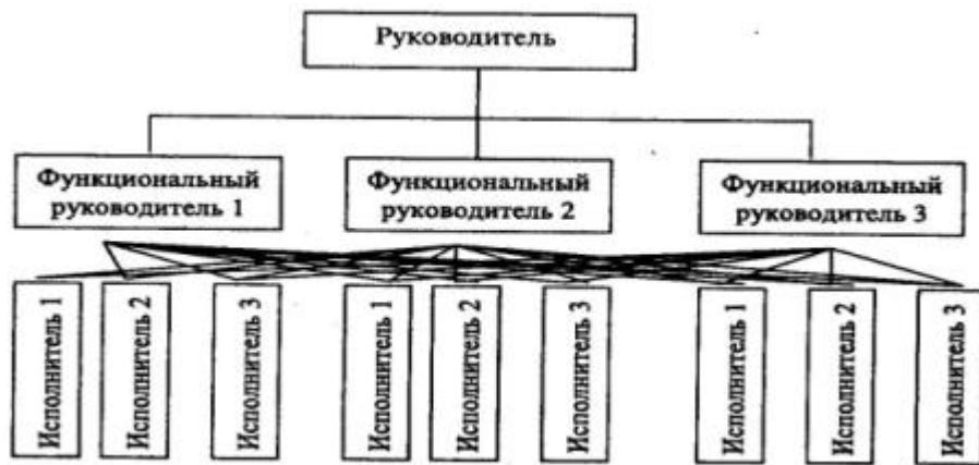
Рис. 2. Функциональная структура управления

предприятий или организаций основным подходом к формированию подразделений является функциональный. Под функциями в данном случае понимаются главные направления деятельности, например, производство, финансы, сбыт и т.п. В соответствии с функциями образуются блоки подразделений - производственный, управленческий, социальный.