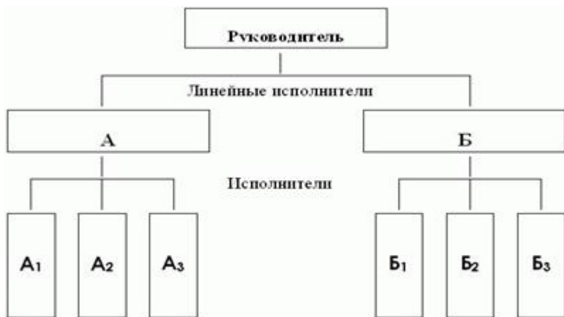
Рис. 1. Линейная структура управления

Линейная структура управления (рис. 1) является наиболее приемлемой лишь для простых форм организаций. Отличительная черта: прямое воздействие на все элементы организации и сосредоточение в одних руках всех функций руководства. Структура хорошо работает в небольших организациях при высоком профессионализме и авторитете руководителя.