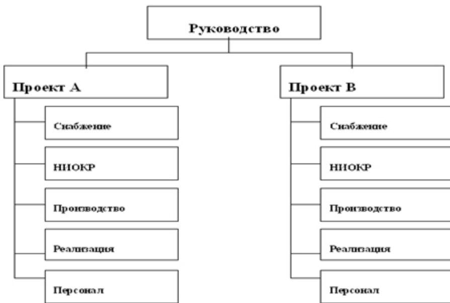
Рис.5. Дивизиональная структура управления

В то же время дивизиональные структуры управления привели к росту иерархичности. Они потребовали формирования промежуточных уровней менеджмента для координации работы отделений, групп и т. п. Дублирование функций управления на разных уровнях в конечном счете привело к росту затрат на содержание управленческого аппарата. В самих производственных отделениях управление строится по линейно-функциональному типу, что иллюстрирует рис. 5, на котором представлена типичная для современной организации дивизиональная структура управления.